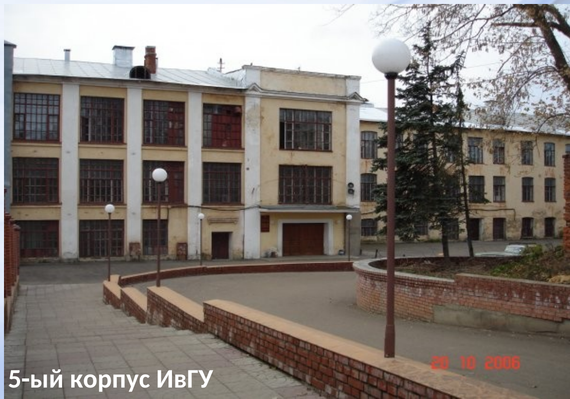
5-ый корпус ИвГУ