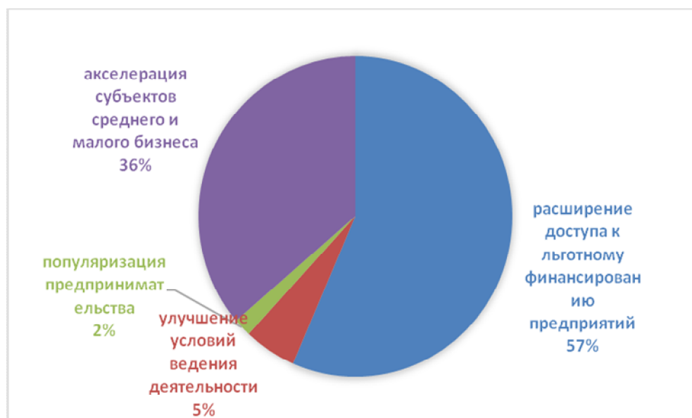
Рис. Финансирование направлений поддержки малого и среднего бизнеса, в % от общего объема выделенных средств на реализацию проекта «Малое и среднее предпринимательство и поддержка индивидуальной предпринимательской инициативы»

Изучение предпринимателями теоретических основ проектного управления, формирование у них практических навыков менеджмента и дизайна проектов имеет очень важное значение не только для сохранения их бизнеса, но и для развития экономики регионов и национальной экономики в целом.