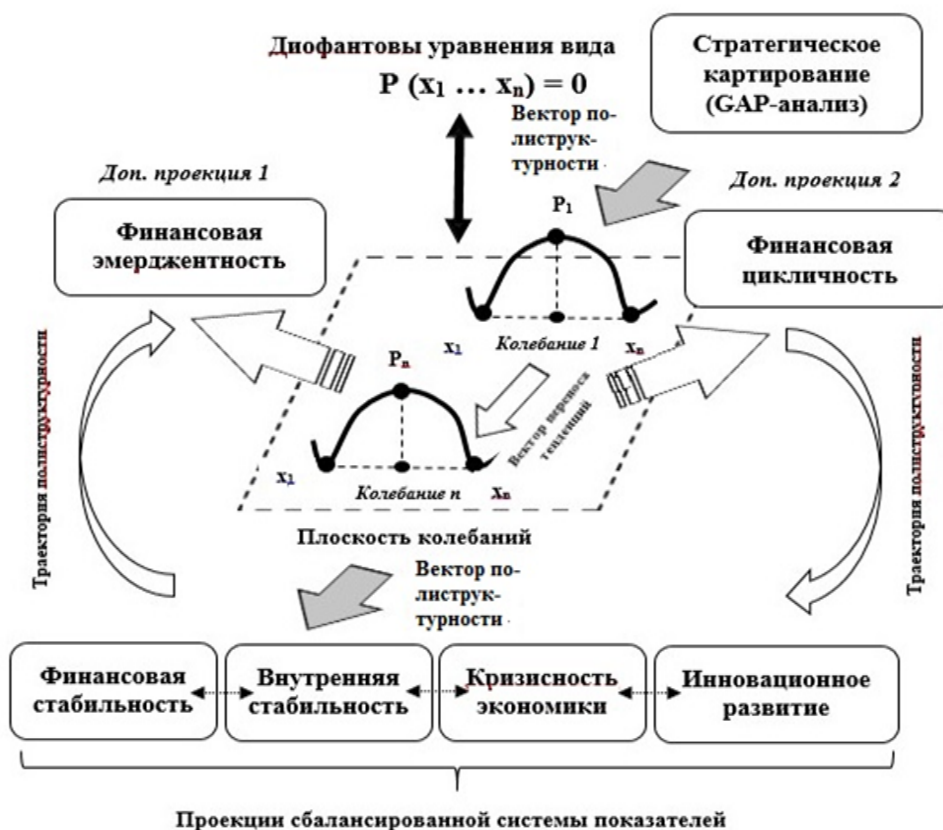
Рис. 1. Модель комплексной оценки полиструктурности инновационных драйверов антикризисного управления кластеризацией производственной системы Ивановской области и организации системы «директ-костинг» в региональном кластере

процедур «директ-костинга», различных параметров кластерных процессов региональной экономики и условий конкурентных преимуществ кластерообразующих предприятий (носителей прямых и косвенных затрат) проведенная оценка полиструктурности концепций сбалансированной системы показателей, диофантовых уравнений и стратегического картирования на основе GAP-анализа основывается на формировании двух дополнительных стратегических проекций («Финансовая эмерджентность» и «Финансовая цикличность») (рис. 1). Наблюдаемая при построении траектории полиструктурности переплетаемость основных и дополнительных проекций сбалансированной системы показателей регионального кластера обеспечивает учет и планирование себестоимости с использованием системы «директ-костинг» не только в части переменных затрат, но также с участием постоянных при последующем их прямом и обратном распределении по носителям затрат. В конечном итоге данные причинно-следственные связи образуют инновационную модель комплексного влияния полиструктурности элементов интегрированной сбалансированной системы показателей на процесс «директ-костинга» в управленческом учете кластерообразующих предприятий региона (рис. 2).