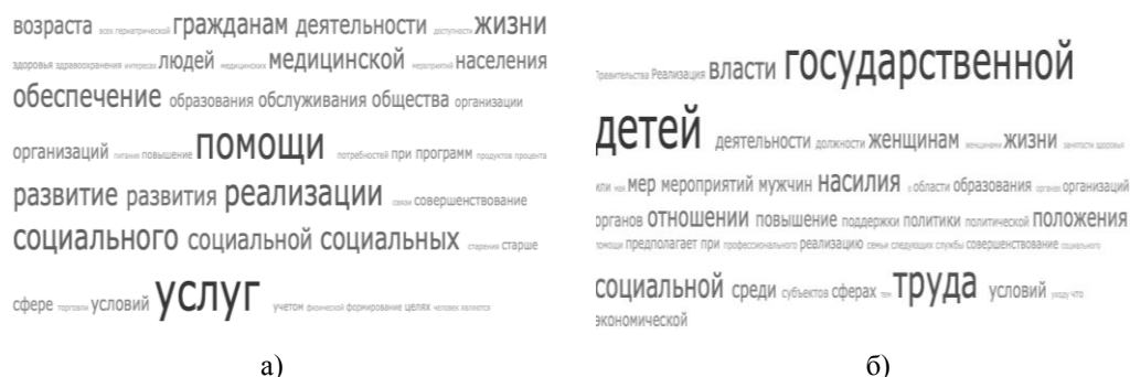
Рис. 3. Облако тегов а) Национальной стратегии действий в интересах граждан старшего поколения (2016 г.), б) Национальной стратегии действий в интересах женщин (2017 г.)

На рисунке 3 облака тегов Национальной стратегии действий в интересах граждан старшего поколения и Национальной стратегии в интересах женщин выявляют один из основных подходов, характерных для данных документов, — акцент на патернализм (зависимость от государственной поддержки). Слова «помощь» и «услуга» преобладают в первом тексте и слово «государственной» (власти, политики) во втором. В Нацстратегии в интересах женщин акцент сделан на материнстве (слово «детей») и труде («труд»), что очень напоминает советскую модель социальной политики в области так называемого женского вопроса: защита материнства и детства, создание условий для совмещения родительских и производственных обязанностей исключительно для женщин (у читателя новой семейной концепции возникает эффект дежа-вю). Вновь поддерживается только «контракт работающей матери» [Темкина, Роткирх, 2002].