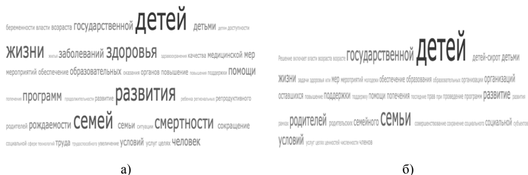
Рис. 2. Облако тегов а) Концепции демографической политики (2007 г.), б) Концепции семейной политики (2014 г.)

На рисунке 2 мы видим, что Концепция демографической политики даже богаче акцентами в области развития человеческого потенциала, чем Концепция семейной политики. Концепция семейной политики в целом проигрывает в разномобразии акцентов и Концепции демографической политики.