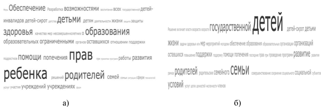
Рис. 1. Облако тегов а) Национальной стратегии действий в интересах детей (2012 г.), б) Концепции семейной политики (2014 г.)

словом «дети», не выделяя каждого ребенка как уникального и ценного объекта и субъекта социальной политики. Принцип участия объекта политики в реализации политики и превращения его в субъекта политики был заложен только в Национальной стратегии действий в интересах детей. Единственный концептуальный документ в России в области социальной политики, в котором отдельным важным принципом считалось участие детей в реализации социальной политики, остается Национальная стратегия действий в интересах детей. В Концепции семейной политики дети больше не являются субъектом политики, интенсивность использования сюжетов про образование и здоровье снижена. В этом документе появляются слова «ценности» (традиционные), «сохранение», что свидетельствует о повороте к традиционализму и консерватизму. Отдельно подчеркивается именно государственное участие в реализации семейной политики, что наводит на мысль об усилении патернализма. Палитра акцентов становится менее разнообразной.